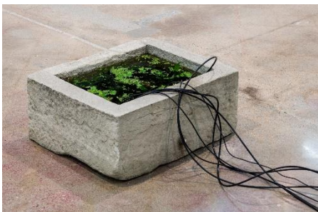
Šepetalci , postavitev, Jones Center, (Austin, Texas, ZDA), 2022