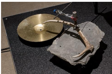
Val , postavitev, Jones Center, (Austin, Texas, ZDA), 2022