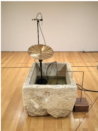
Šepetalci , postavitev, Flag Art Foundation (New York, ZDA), 2022