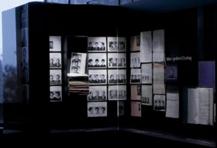
Časopisovje izredakoga lista | Building a Character