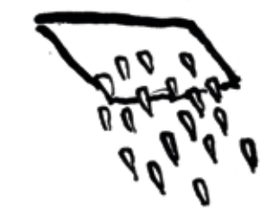
THERE IS NO CHEESY TEXT.