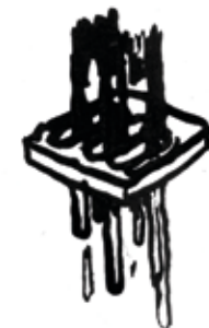
FELT JUST LIKE OPEN AIR